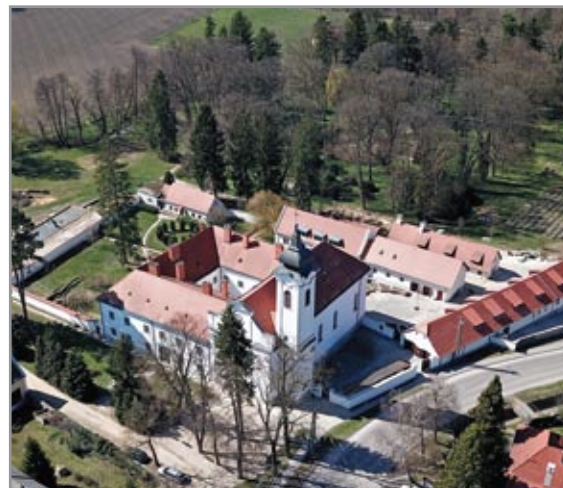
A monostor látképe északkeletről