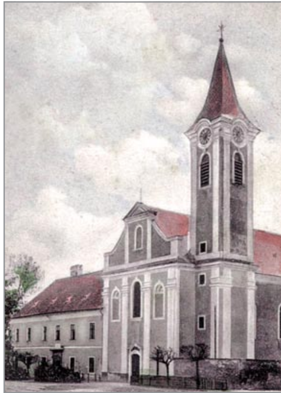
Képeslap a monostortemplomról a 20. század elejéről

Az 1696-ban visszatért szerzetesek a romokon új templom építésébe fogtak. Az 1720-as években Bakonybél falut újrateremtették, a ma látható barokk templom 1754-re készült el. Guzmics Izidor apáti szolgálatának időszakában (1832–1839) Bakonybél jelentős szellemi központként működött; az épületben kialakított rendi tanárképző főiskolából olyan, utóbb jelentős hírnevet szerző diákok kerültek ki, mint Rónay Jácint vagy Rómer Flóris. A 19. század közepe után felújítási munkálatok kezdődtek, melyek 1878-ban fejeződtek be. A monostor a 20. század elején a