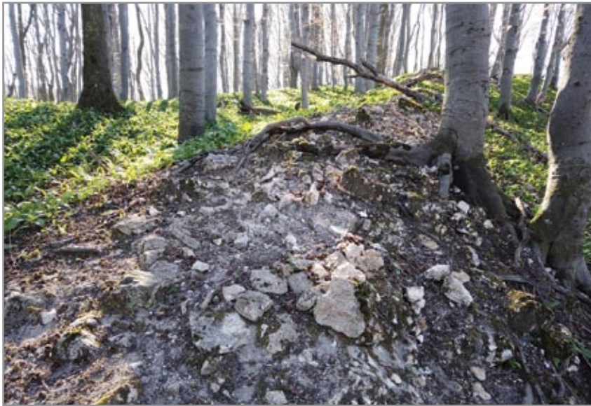
Kőfal omladéka a külső vár övezőfalának helyén