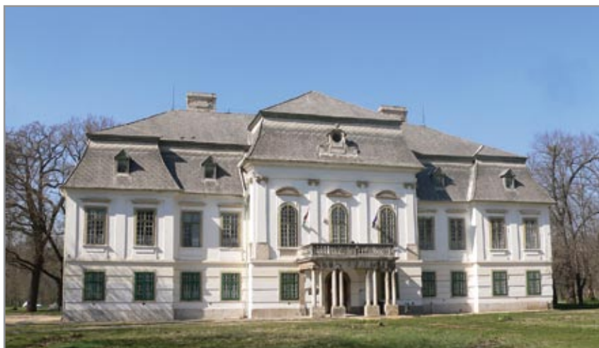
Lovászpataona kastélya ma iskolaként működik

Addig sem rostokoltunk tétlenül, berregő műszaki csodánkat megint bevetettük, és elmélyülten próbáltuk a templom kevésbé árnyékos déli oldalát minél jobban „lekapni”. Ekkor váratlanul odabaktatott hozzánk a falu „bölcs régésze”, aki ugyan meglehetősen illuminált állapotban volt, ám annyit már az elején ki lehetett hámozni rövid és többnyire összefüggéstelen mondataiból, hogy „ő bizony nagy kincseket talált a határban, amit jó volna pénzzé tenni”. Laci szóba elegyedett velem, én viszont úgy éreztem, nekem ez a „bónusz” így a nap vége táján kissé már sok. A közel-