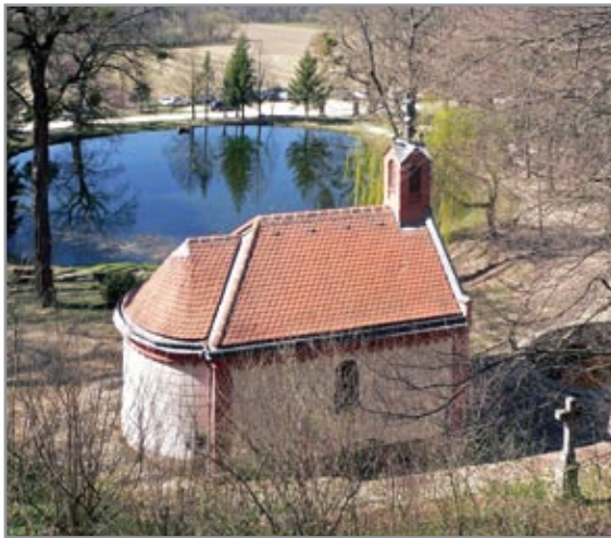
A Szűz Mária-kápolna látképe a Szent Gellért-szikla oldalából

munkából és a tanításból kiöregedett, idős rendtagok nyugodalmas otthonaként szolgált. 1950-ben, a pártállam időszakában a szerzeteseket elűzték, majd néhány nappal később, 1950 októberében gráci irtalmas nővérek érkeztek ide és szeretetotthonként működtették a monostort, egészen a rendszerváltásig. 1998-ban a szerzetesek visszakapták tulajdonukat, 2018-ban a templom kívül-belül megújult. A monostor jelenleg a Magyar Bencés Kongregáció része, a Pannonhalmi Főapátság függő perjelsége. A közösséget öt örök fogadalmas és két ideiglenes fogadalmas szerzetes, valamint két növendék alkotja.