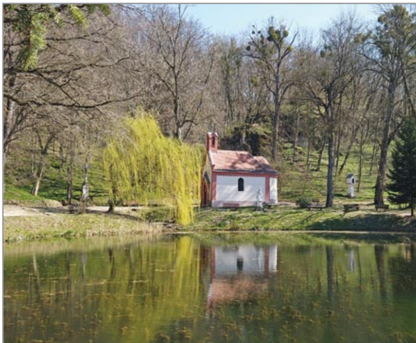
A Szűz Mária-kápolna a tóval, háttérben a Szent Gellért-szikla látható

bolton emelkedő-süllyedő látványosság irányába, a derék szerzetesek pedig a fejüket vakargatták: „No, már csak ez hiányzott!” Ezúttal tényleg csodálatos képek születtek, nyakamban lógó, súlyos fényképezőgépet néhány pillanatig idejétmúlt őskövületnek éreztem.