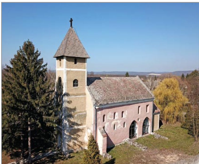
Lovászpataona temploma délről