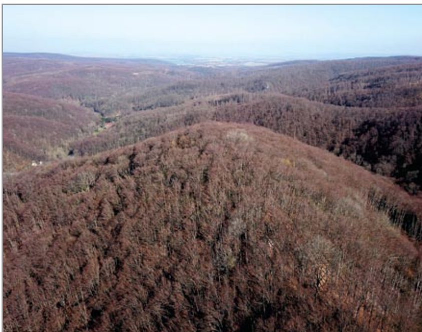
A kép előterében a tekintélyes méretű bakonyújvári várhegy látható, dél felől

valójában nem ismert (nem is szólva a feltételezett 13–14. századi erődítményről), egyedül Virágh Dénes felmérése áll a rendelkezésünkre, melynek nyomán nagy vonalakban következtethetünk Bakonyújvár eredeti méreteire, hozzávetőleges formájára.