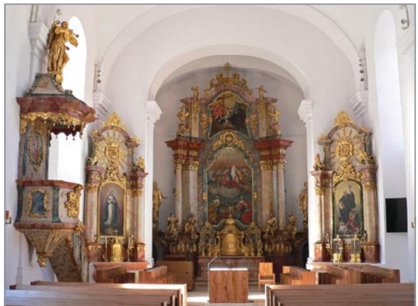
A monostortemplom a barokk templombelsővel