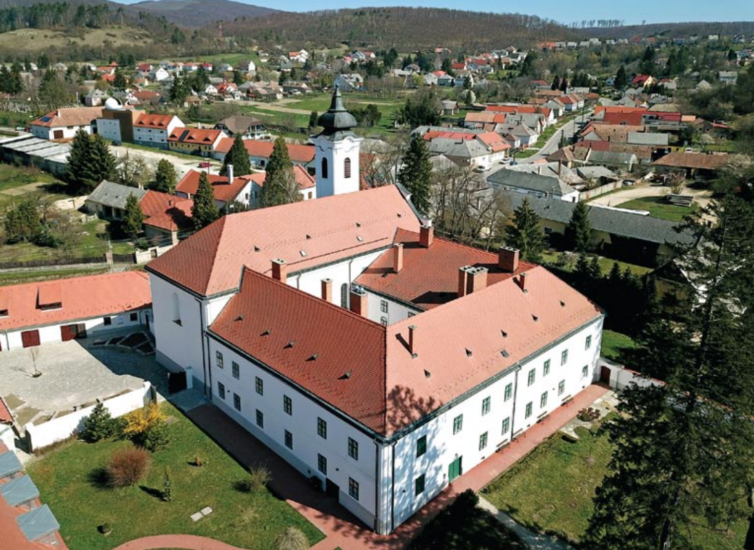
Bakonybél monostorának "drón-látképe" délnyugatról