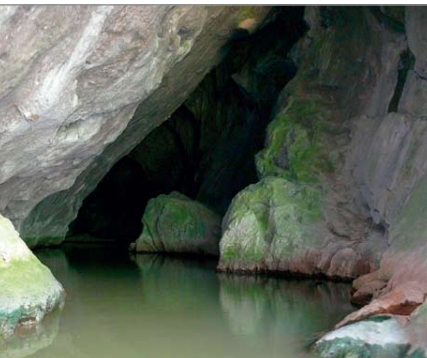
A Ponyikovai-barlang bejárata jelenleg vízben áll

hogy szabad elvonulás feltétele mellett beszüntetik az ellenállást. Amikor azonban a védők előjöttek a barlangból, hitesztető módon foglyul ejtették őket. Kilenc hónappal később nyerték csak vissza szabadságukat: a hős kis csapatot kicserélték a Nagyváradi elfoglalásakor foglyul ejtett törökökkel. Az elhíresült ostrom után a Piscabara-barlangot Veterani-barlangnak nevezték el, bár maga a tábornok valószínűleg sosem járt ezen a helyen.