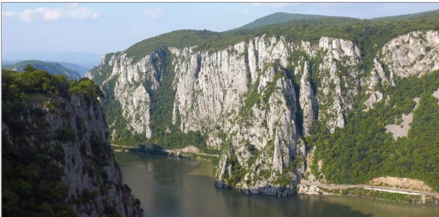
Kilátás a Csukár fennsíkjáról a túlpartra, ahonnan a törökök ágyúzták a barlangot