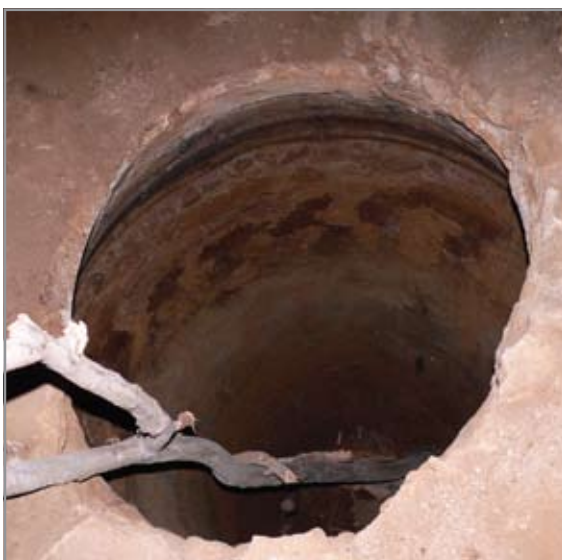
A Veterani-barlang kútja