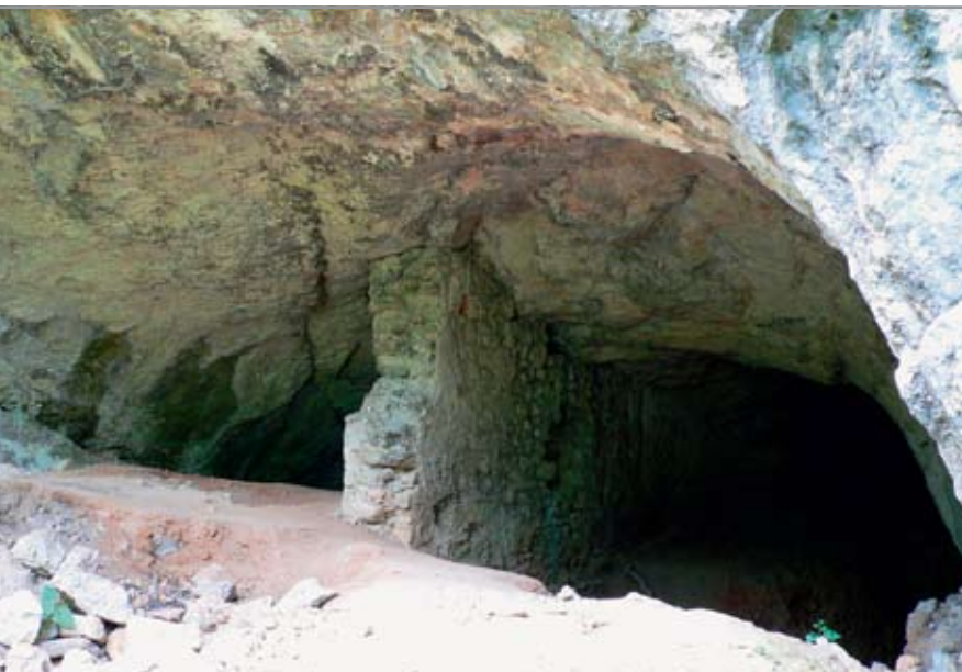
A Veterani-barlang bejárata