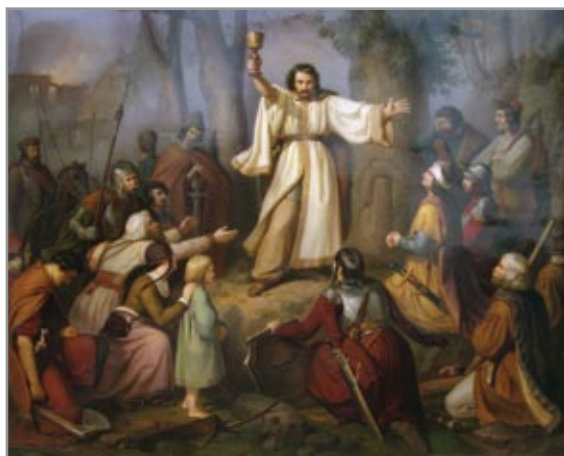
Husziták áldozása az erdőben (Carl Friedrich Lessing festménye, 1836). A helyi tradíciók szerint hasonló jelenetek játszódhattak le az Oltárkőnél is a 15. század közepén.

Bohuš Nosák-Nezabudov szerint (Orol Tatránski II. 1847/56. sz. 443. old.) Felsősom falu fölött „az Oltárkő nevű barlang Kisszeben lakosait napjainkig emlékezteti a mongolok támadására Magyarország ellen. Állítólag oda menekültek a sárosiak a környező falvakból, és oltárt építve körülötte imádkoztak, hogy az Úr a vad tatároktól megszabadítsa őket.” (Itt a jelenleg Zsványlyuk-barlangnak nevezett üregről van szó.)