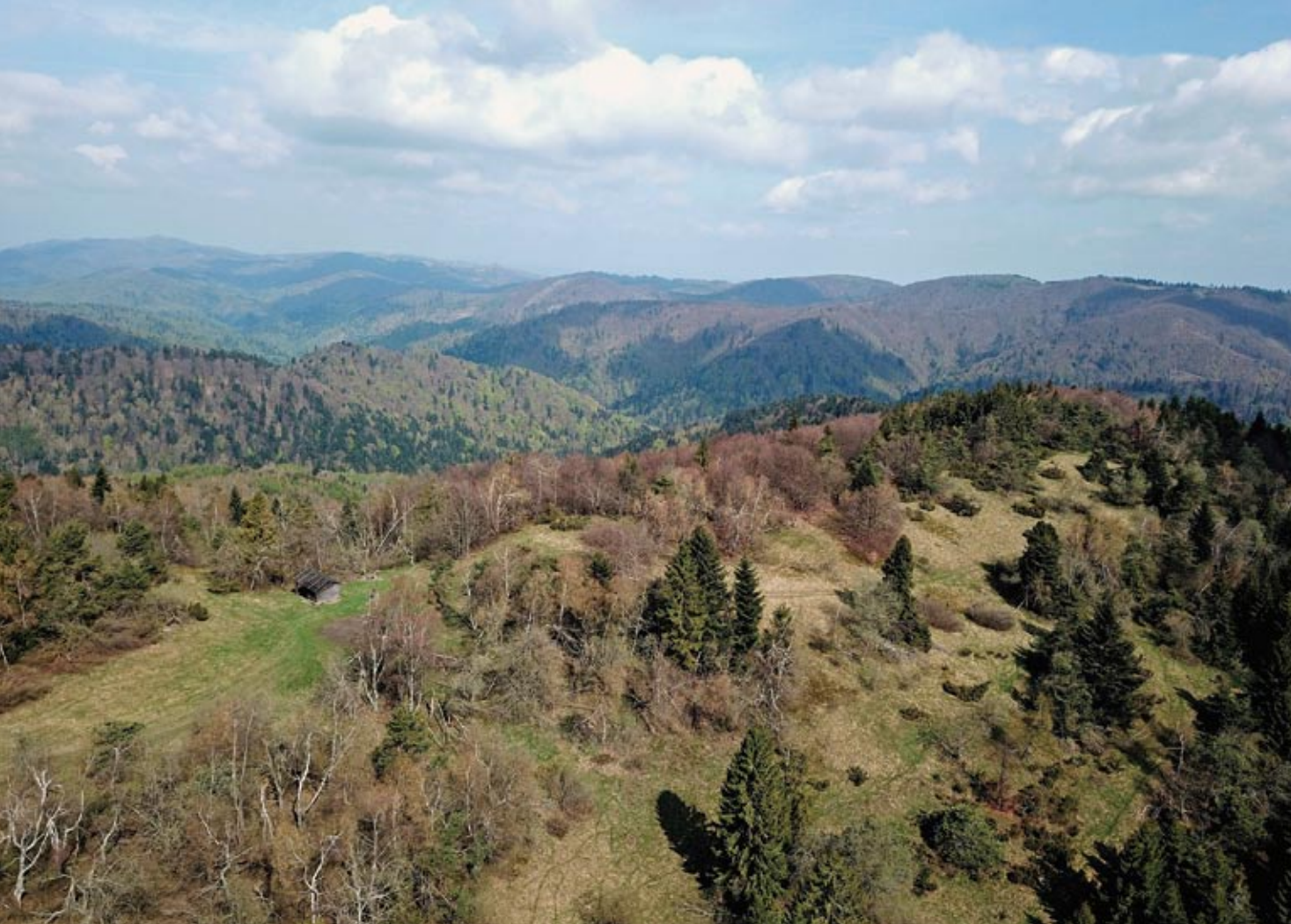
A kép előterében húzódó dombtetőn, a faházikótól jobbra található Oltariszka várának helye