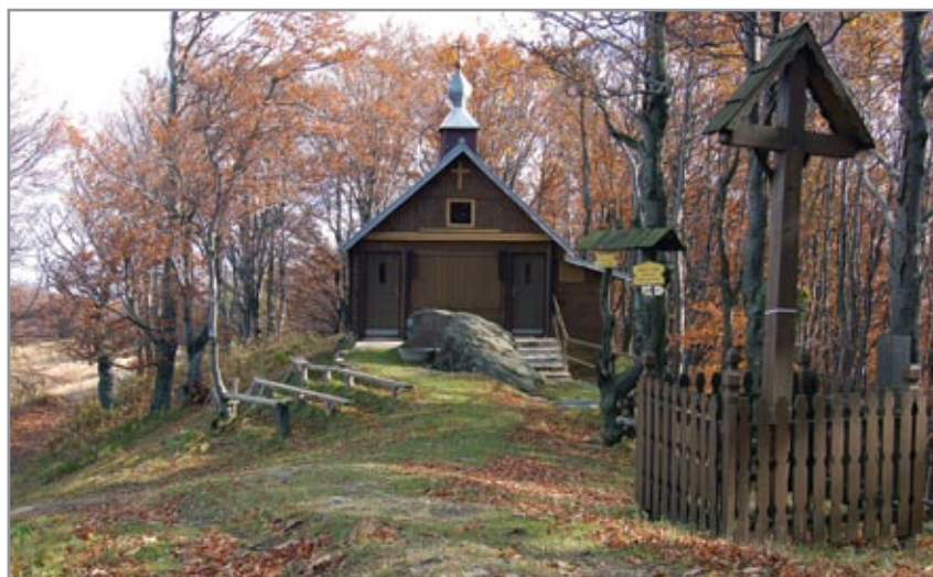
Az Oltárkőn létesített kápolna ősszel, napjainkban

Az Oltárkő-szikla jelenleg 4 méter hosszú és 1,5–1,8 méter széles, magassága 1–2,5 méter. A közelmúltban még sokkal látványosabban kiemelkedett a környező felszín fölé, de a kápolna építése során kavicsal és homokkal jelentős mértékben körülszórták, feltöltötték. A sziklán régebben állítólag különböző feliratok, ősi jelek és szimbólumok, sőt rovásfeliratok is látszottak. Ezek legtöbbje mára annyira lekopott,